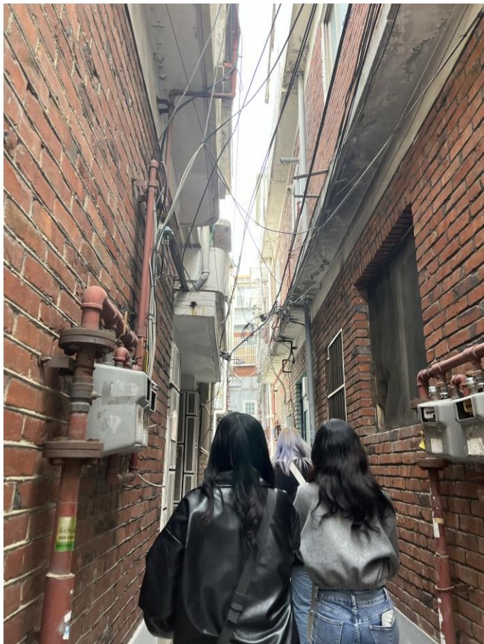
韓国ならではの路地裏